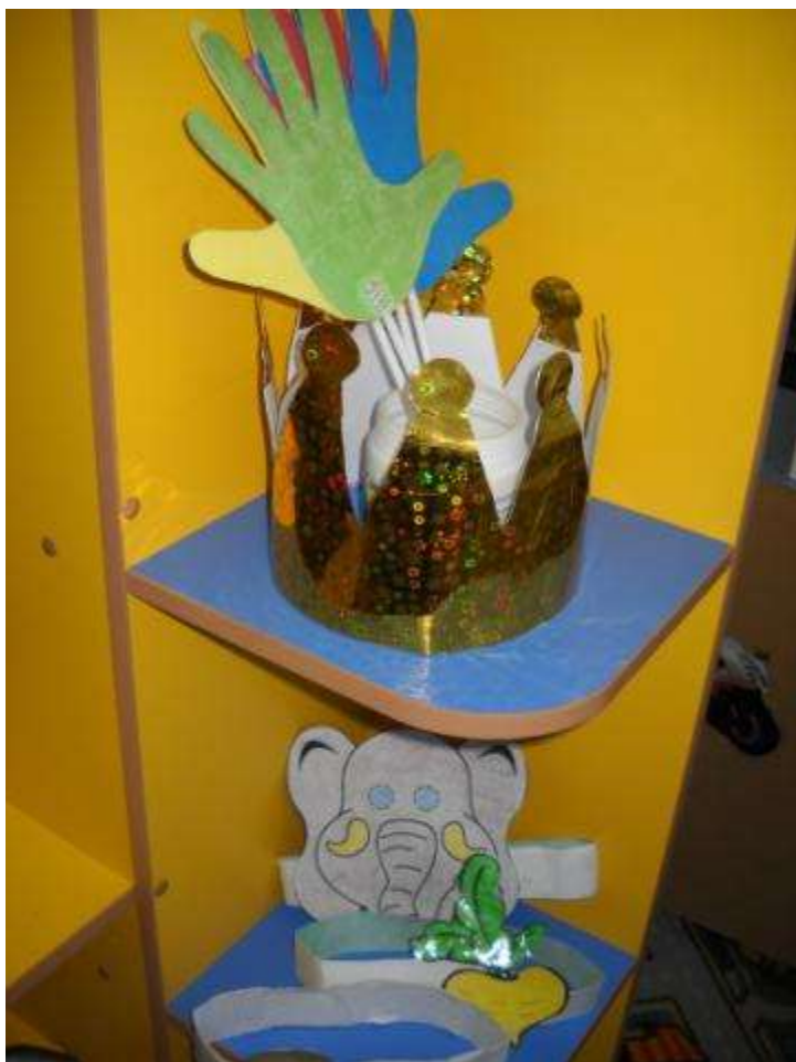
Центр конструирования и ПДД