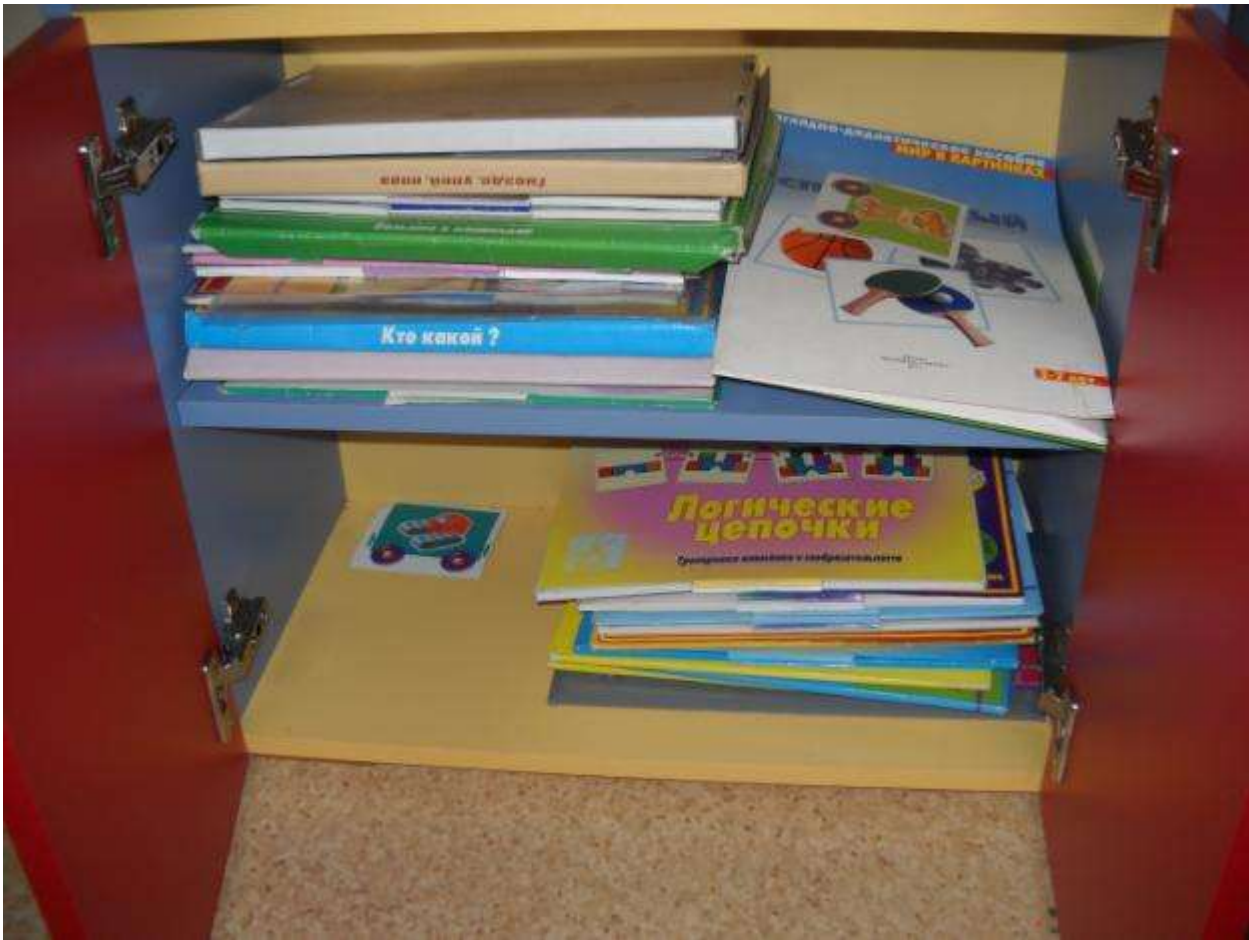
Центр познания и экспериментально-исследовательской деятельности